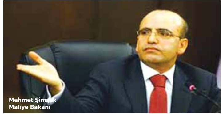
Mehmet Şimşek Maliye Bakanı