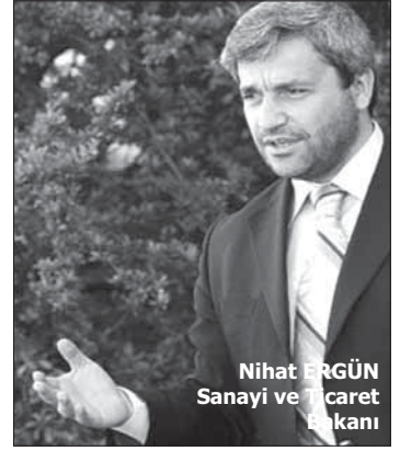
Nihat ERGÜN Sanayi ve Ticaret Bakanı

SMIIC tüzüğünü 16 ülkenin imzaladığını bilgisini veren Ergün, 11 ülkenin de tüzüğü onayladığını kaydetti. Bu sayının hızla artmasını gerektiğini vurgulayan Ergün, SMIIC’nin yapacağı çalışmalarla üye ülkeler arasındaki ticaretin hız kazanmasının da amaçladığını ifade etti.