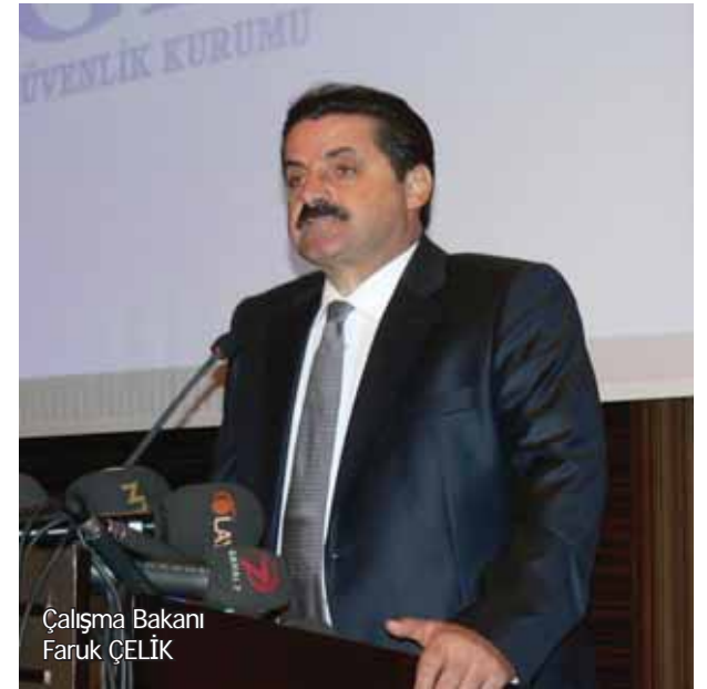
Çalışma Bakanı Faruk ÇELİK

kaçındığına ilişkin iddiaların anımsatılması üzerine Çelik, bugüne kadar 11 milyon 600 bin kişinin gelir testi yaptırdığını, 8 milyon 45 bin kişinin priminin devlet tarafından karşılanacağını söyledi. Çelik, "Önümüzdeki dönem içerisinde kendilerine birkaç kez iş sunduğumuz ve mesleki eğitim imkânı sağladığımız yeşil kartlılar, çalışmama konusunda bir direnç gösterirlerse yeşil kart imkânından mahrum olacaklardır" dedi. Kıdem tazminatı tartışmalarına da değinen Çelik, yıllardır tartışma konusu olan kıdem tazminatını, Meclis'te görüşülmeyi bekleyen Toplu İş İlişkileri Yasası çıkmadan gündeme almayacaklarını söyledi.