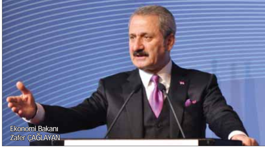
Ekonomi Bakanı Zafer ÇAĞLAYAN

Haziran ayındaki 4.2 milyar dolarlık açığın aylık bazda son 10 ayın en düşük açığı olduğunu, yıllıklandırılmış 63.5 milyar dolar açığın ise son 12 ayın en düşük düzeyi olduğunu vurgulayan Çağlayan "Şu an itibarıyla OVP hedefi