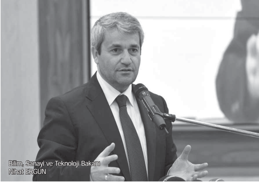
Bilim, Sanayi ve Teknoloji Bakanı Nihat ERGÜN

B ilim, Sanayi ve Teknoloji Bakanı Nihat Ergün, bakanlıkta düzenlediği basın toplantısıyla, Başbakan Recep Tayyip Erdoğan'ın başkanlığında gerçekleştirilen Bilim ve