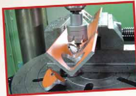
Köşebent metallerde kesin çözüm.