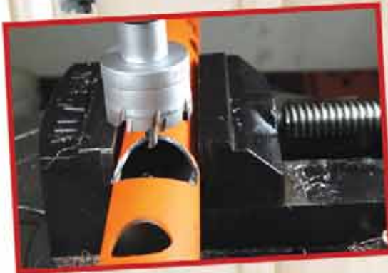
Metal/Paslanmaz borularda hasarsız kesim.