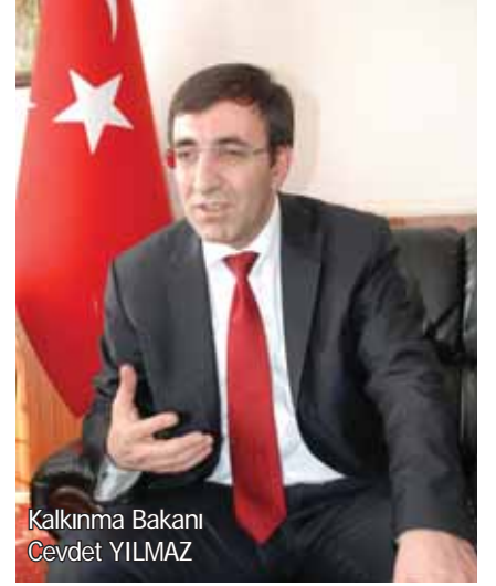
Kalkınma Bakanı Cevdet YILMAZ

Bakan Yılmaz, Batı bölgelerde kurulu şirketlerin Doğu'ya gelerek yatırım yapmaları halinde önemli ölçüde vergi avantajına sahip olacaklarını söyledi. Yılmaz şöyle konuştu: "Bunu ilk kez yaptık. Bunun için kentin fırsatlarını, hangi yatırım alanlarının