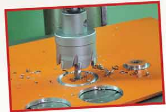
Paslanmaz çelik malzemelerde mükemmel kesme performansı 5mm Kalınlığa kadar metallerde rahat ve kusursuz kesim