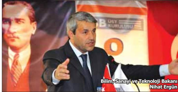
Bilim, Sanayi ve Teknoloji Bakanı Nihat Ergün

✓ Bilim, Sanayi ve Teknoloji Bakanı Nihat Ergün, yeni dönem projelerine ilişkin açıklamalar yaptı. Türkiye'nin yeni yatırımlara ihtiyacı olduğunu belirten Bakan Ergün, sanayi bölgelerinde köklü reformlara imza atacıklarını söyledi.