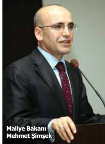
Maliye Bakanı Mehmet Şimşek

Bunu dizayn ederken özellikle büyük yatırımlar dediğimiz yatırımları biz orada destekledi. Daha doğrusu dış ticaret açığının büyük oranda yaşandığı alanlara daha fazla teşvik verme prensibini kabul etmiş-tik. Şimdi bir adım daha öteye gidiyoruz. Yani çok spesifik ürünlerde, spesifik alanlarda üretimi teşvik edecek yeni yaklaşımlar içerisine gireceğiz. Bu konuya ilişkin