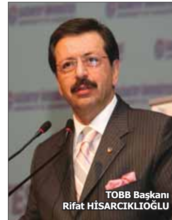
TOBB Başkanı Rifat HİSARCILIOĞLU

EPDK Başkanı Hasan Köktaş ise bugün 72 rüzgar santrali sayısına ulaşıldığını söyleyerek, "Devreye alınan tesislerin yatırım tutarı 1.6 milyar dolar euro'yu buldu" dedi. 48 bin MW kurulu gücündeki 802 adet rüzgar enerji santrali başvurusunda son aşamaya geldiğini bildiren Köktaş, "TEİAŞ tarafından 10 paket halinde yarışmalar tamamlandı, hızlı şekilde lisanslandırılıyor. 9 milyar euroluk bir tutara denk geliyor. Özel sektör üzerine düşen sorumluluğu yerine getirerek, bir an önce bu santralleri tamamlamalı" diye konuştu.