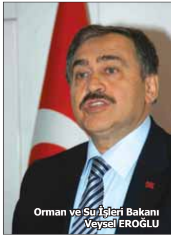
Orman ve Su İşleri Bakanı Veysel EROĞLU