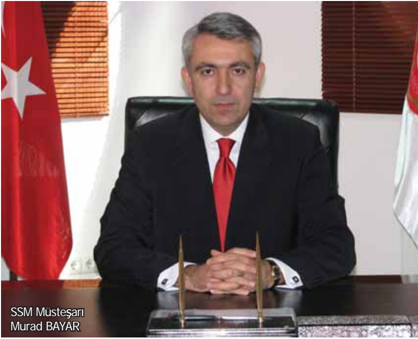
SSM Müsteşarı Murad BAYAR

D ünya savunma ve havacılık sanayinin dev isimleri OSTİM Savunma ve Havacılık Kümelenmesi (OSSA) ile Fransız organizasyon firması BCI'nin organizatörlüğünde ve SSM'nin desteğiyle; 6-8 Mart 2013 tarihinde Congressium Kongre Merkezi'nde gerçekleştirilecek olan Savunma ve Havacılıkta Endüstriyel İşbirliği Günleri kapsamında Türk firmalarıyla buluşmak için Türkiye'ye geliyorlar.