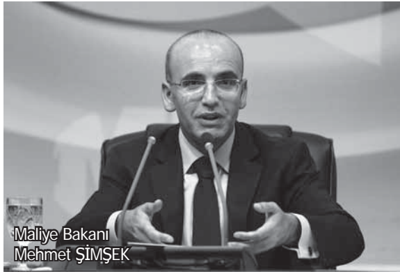
Maliye Bakanı Mehmet ŞİMŞEK

Maliye Bakanı Mehmet Şimşek, çalışmalarını süren yeni Gelir Vergisi Kanun Taslağı'nın hazır olduğunu duyurdu. Taslağın Ekonomi Koordinasyon Kurulu (EKK) toplantısında sunulacağını belirten Şimşek, "Gelir ve Kurumlar Vergisi kanunlarını birleştiriyoruz. Bu çerçevede biz, 250 maddelik bir kanunu yaklaşık 100 maddenin altına indiriyoruz... Önemli bir konu, istisnaları daraltacağız. Örnek olarak vereyim, diyelim ki futbolcular çok iyi para kazanıyorlar Süper Lig'de. Onların vergi oranı yüzde 15, örnek olarak diyorum. Ama siz diyelim ki bir şirkette üst düzey yöneticisiniz, siz de iyi maaş alıyorsunuz, sizin vergi oranınız yüzde 35'e kadar çıkıyor. Bu tür muafiyetler var. Bunların hepsini gözden geçiriyoruz. Yani 8-10 sayfa kapsayan muafiyet ve istisnalar var. Bundan sonra yani halen vergi ödemeyen bazı kesimler veya az ödeyen bazı kesimlerin, artık normal vergi oranlarına tabi olma ihtimalleri yüksek" diye konuştu. Bakan Şimşek, düzenleme ile yeni vergi getirilmeyeceğini, vergi oranlarıyla oynanmayacağını da vurguladı.