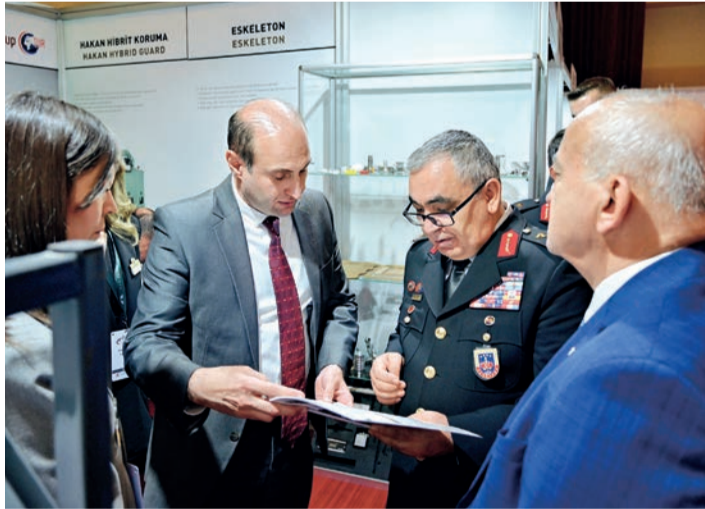
Jandarma Genel Komutanlığı Asayiş Başkanı Tümgeneral Çengiz Yıldız, ICDDA'24 etkinliğini ziyaret ederek firmaları tebrik etti. Yıldız, OSTİM'le gurur duyduklarını söyledi.