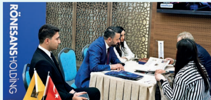
Etkinlikte raylı sistem müteahhit firmaları ile ARUS üyeleri arasında ikili iş birliği görüşmeleri gerçekleştirildi.